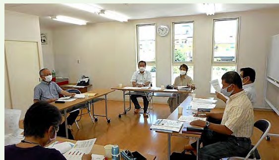
理事会 美園会議室