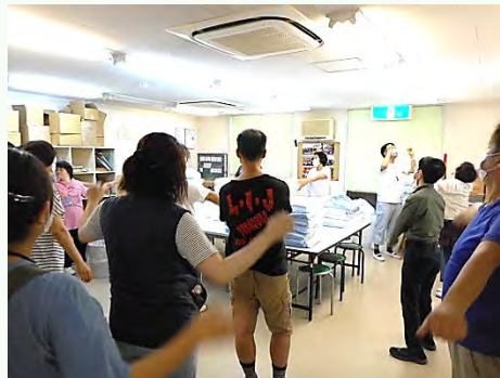
作業前のラジオ体操