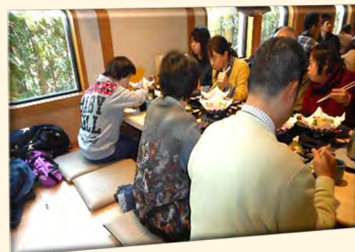
レクリエーション 散策と食事風景