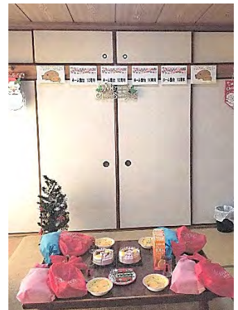
和室・作品づくり