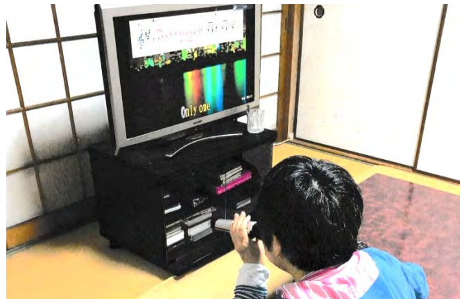
カラオケを楽しむ！