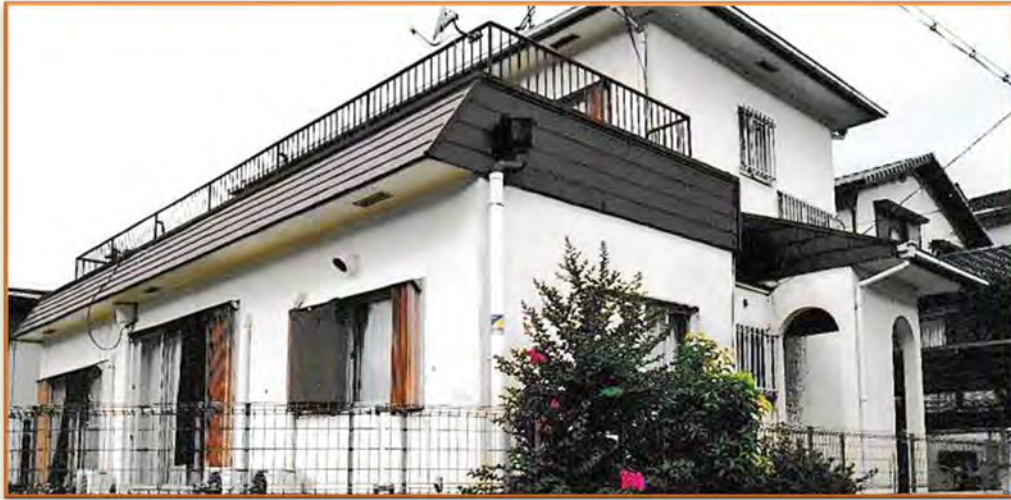
南側・庭に面した部屋

ご家族から離れて、世話人や利用者との共同生活を通じて、自立して暮らせるような環境づくりに努めています。