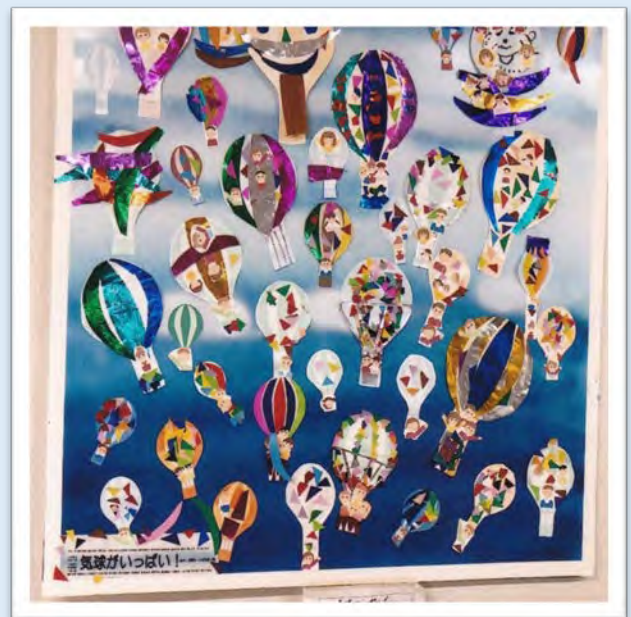
宿泊利用者 全員 33名で作成した労作の作品展“乗って大空へ”！ 玉垣指導