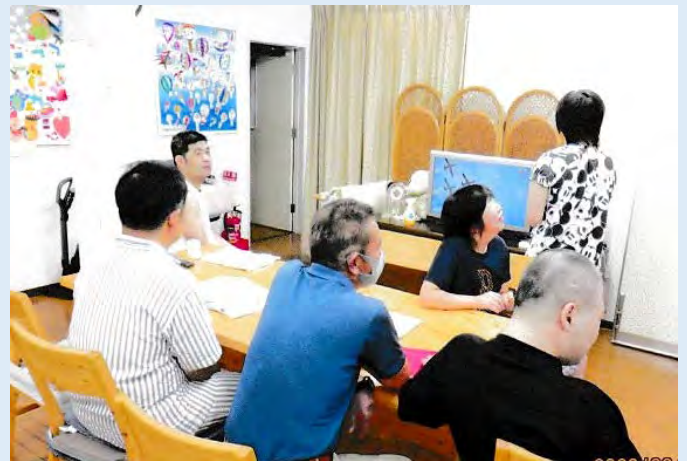
美園ホームイベント カラオケを楽しむ！